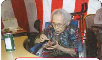
たこ焼き美味しい〜♪♪