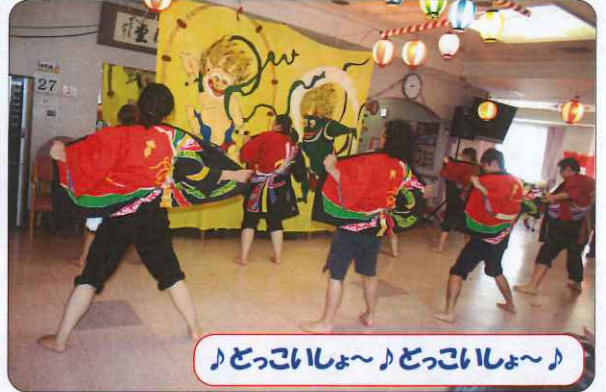
♪どこいしよ〜♪どこいしよ〜♪