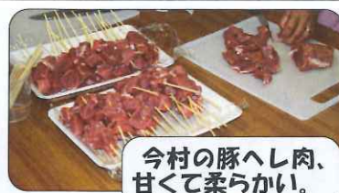
今村の豚へし肉、甘くて柔らかい。