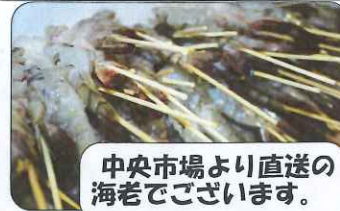
中央市場より直送の海老でございます。