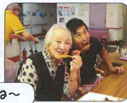
美味しい～海老フライだね～