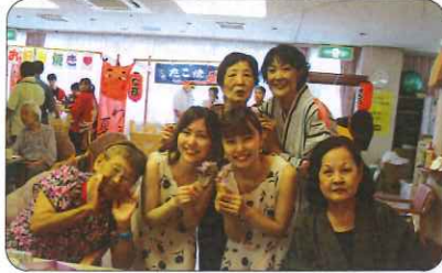
みなさん笑顔でハイ！チーズ♪♪

秋号 介護老人保健施設 サンガピア館 〒569-0034 高槻市大塚町5-20-3 TEL 072-673-6500 デイケア企画係