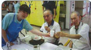
カンパ〜い♪おめでとう!!